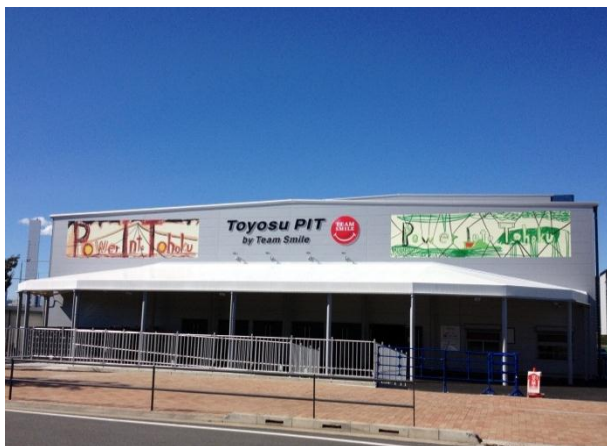
※図1（豊洲 PIT 壁面アート図）