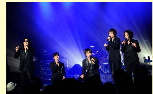
「MUSIC COMPLEX 2013.spring」

http://t2.pia.jp/piacard/feature/ichihaya/pmc.html