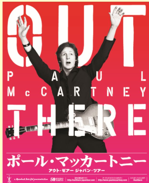
「ポール・マッカートニー アウト・ゼアー ジャパン・ツアー」

http://t2.pia.jp/feature/music/paulmccartney/index.jsp