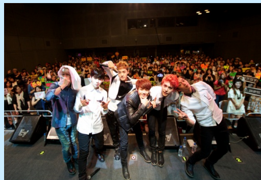
スペシャルライブ「uP!!!SPECIAL」