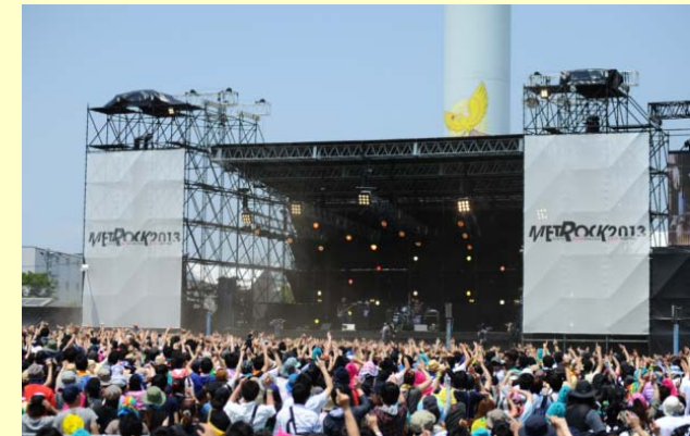
「TOKYO METROPOLITAN ROCK FESTIVAL 2013」