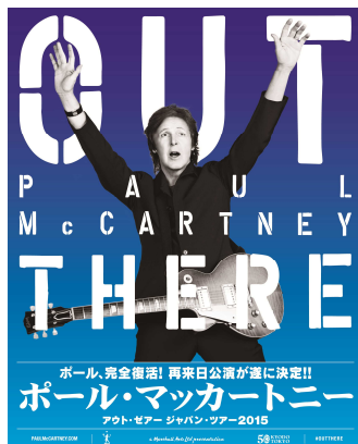
●ポール・マッカートニー 「アウト・ゼア ジャパン・ツアー2015」 http://t.pia.jp/feature/music/paulmccartney/