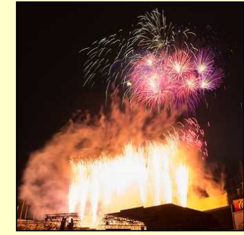
◆ 神宮外苑花火大会