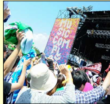
◆ PMC (ぴあフェス)