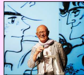
Vol.12 ちばてつやさん (いわき)

当社が参画する震災復興活動チームスマイルでは、豊洲、いわき、仙台、釜石にある4つのホール「PIT」を拠点に、被災地の子どもたちの夢を応援するプロジェクトを継続的に実施