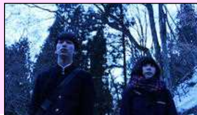
◀ グランプリ 「わたしたちの家」 (清原 惟監督・25歳)