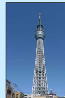
東京スカイツリー