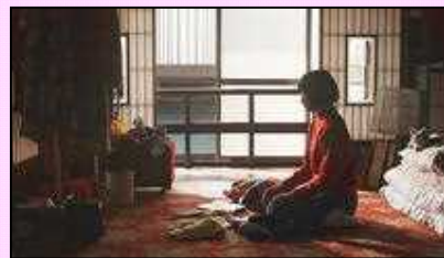
観客賞▶ 「あみこ」 (山中瑤子監督・20歳)