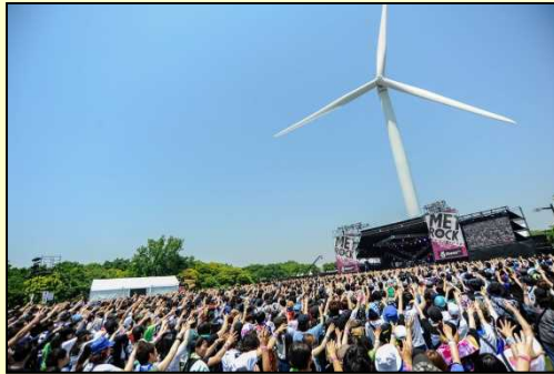
◆ METROCK2017 OSAKA・TOKYO