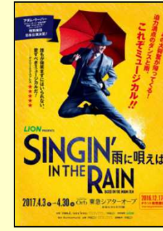
◆ SINGIN' IN THE RAIN