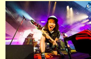
「uP!!!NEXT Vol.15 WANIMA」