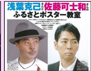
Vol.14 浅葉克己さん、佐藤 可士和さん(いわき)