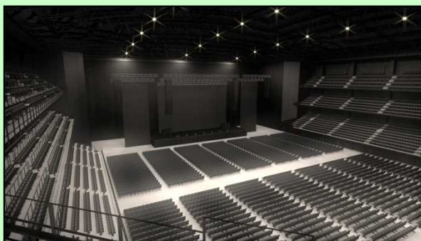
4階スタンドからみた ステージのイメージ

収容客数 1 万人の大型音楽アリーナを当社単独で開設し、ホール・劇場の運営事業に着手。アリーナの開業は2020年春を予定しており、昨年12月には工事に着工。東京五輪開催等に伴う、エンタメ会場不足という社会的課題の解決策の一つとして、主体的に取り組む。