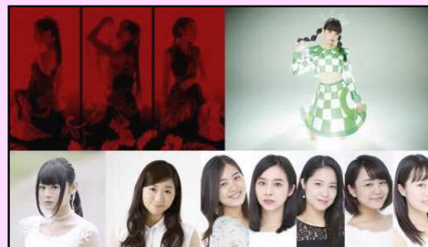
Toyosu Music Collaboration (豊洲PIT)