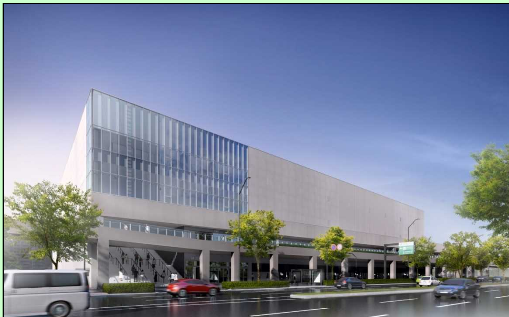
みなとみらい駅、桜木町駅から徒歩数分の好立地

収容客数 1 万人の大型音楽アリーナを当社単独で開設し、ホール・劇場の運営事業に着手。アリーナの開業は2020年春を予定しており、昨年12月には工事に着工。東京五輪開催等に伴う、エンタメ会場不足という社会的課題の解決策の一つとして、主体的に取り組む。