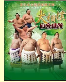
◆ 大相撲 仙台場所 ・なにわ場所