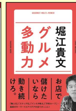
◆ 堀江貴文 グルメ本