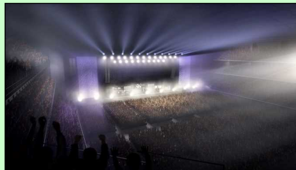
4階スタンドからみた コンサート中のイメージ