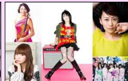
The Unforgettable Day 3.11 (仙台PIT)