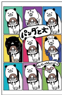
▲東京・大阪・福岡でグッズショップを開催