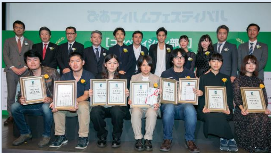
▲第40回PFFの授賞式の模様

昨年、一般社団法人化したPFFが60を超える企業、業界団体からの協賛をいただき40回目を開催。さらなる継続開催を目指す。