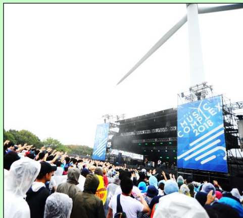
PIA MUSIC COMPLEX -ぴあフェス-