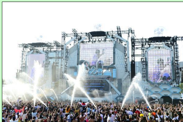
S2O JAPAN SONGKRAN MUSIC FESTIVAL