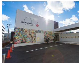
釜石PIT (釜石市にて継承)