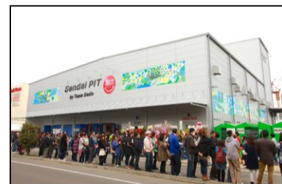
仙台PIT(当社にて継承)