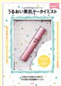
うるおい美肌 ケータイミスト