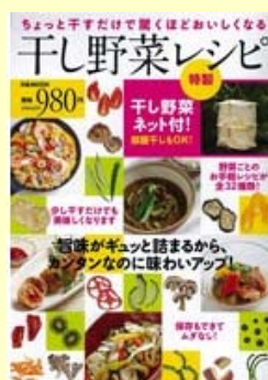
干し野菜レシピ (干し野菜ネット付)