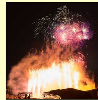
◆神宮外苑花火大会