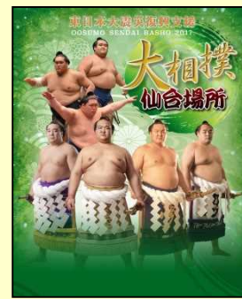
◆大相撲 仙台場所 ・なにわ場所