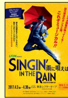
◆SINGIN' IN THE RAIN