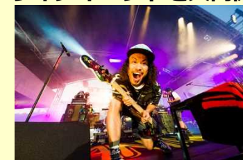
「uP!!!NEXT Vol.15 WANIMA」