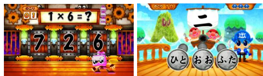
同社が開発した「国語海賊と算数忍者」