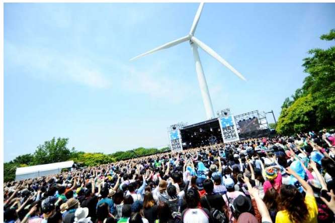
「TOKYO METROPOLITAN ROCK FESTIVAL 2014」