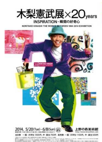
「木梨憲武展×20 years」 http://www.kinashiten.com/