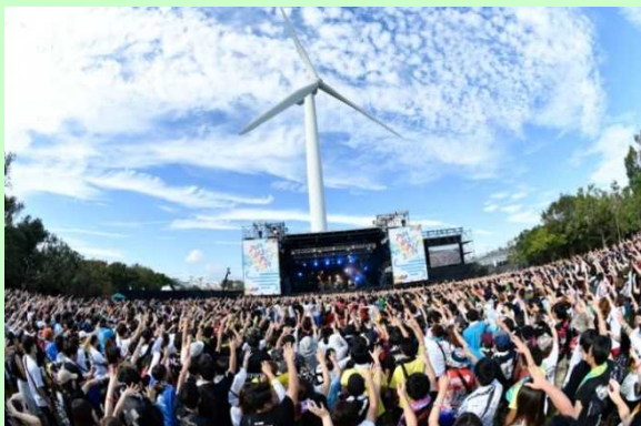
PIA MUSIC COMPLEX 2019 -ぴあフェス-

◆ぴあならではのバリューチェーンの成立に向け、大規模主催興行や、プロモーションメディア展開に注力