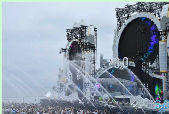
WANIMA x S20 JAPAN Good Job!! Release Party