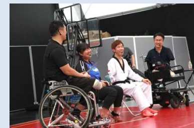
Vol.22 乙武洋匡さんと パラ選手の皆さん(宮城)