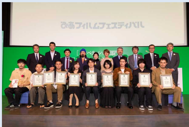
▲第41回PFFの授賞式の模様

一般社団法人PFFが昨年を上回る 66の企業、業界団体からの協賛を 得て、41回目のPFFを開催。 さらなる継続と拡大を目指す。