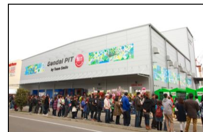
仙台PIT(当社にて継承)