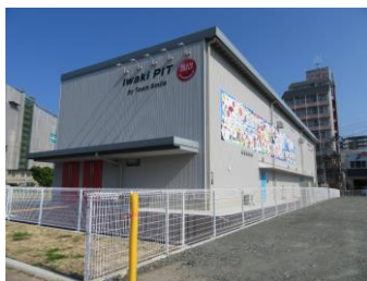
いわきPIT (地元民間企業にて継承)