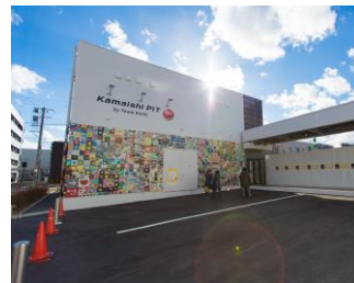
釜石PIT (釜石市にて継承)