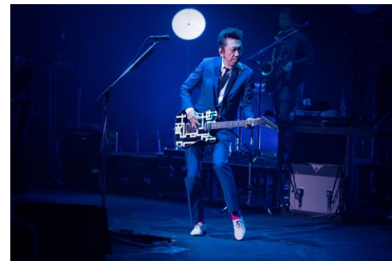
釜石では布袋寅泰さんのライブを開催し、地元の皆様にもお楽しみいただきました(11月)

4つのPITは、そのままの名称で今後も継承され、「豊洲PIT」と「仙台PIT」は当社所有のホールとして今後も運営してまいります。