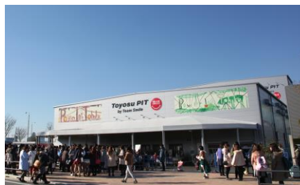
豊洲PIT(当社にて継承)

4つのPITは、そのままの名称で今後も継承され、「豊洲PIT」と「仙台PIT」は当社所有のホールとして今後も運営してまいります。