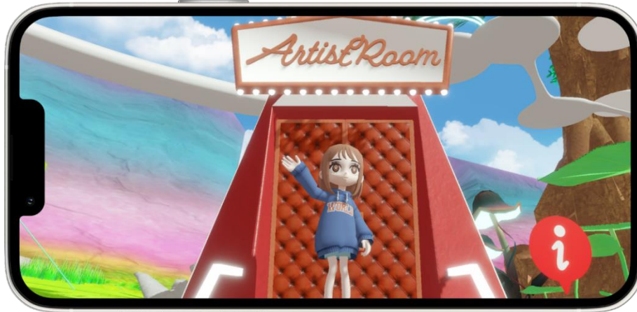
NeoMeパークにあるアーティストルームの入り口イメージ。

「NeoMe Live」に出演するパフォーマー専用のアーティストルームでは、動画やディスコグラフィの展示、フотスポットでの撮影が楽しめます。